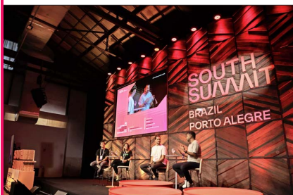
“¿Cuántos de ustedes tienen a la inteligencia artificial trabajando por ustedes en estos momentos?”, preguntó Szapar al público.

Ese cambio abre una discusión más amplia. Si el trabajo deja de ser la principal forma de generar ingresos, también se tensiona la estructura económica actual. Durante el panel se plantearon alternativas como modelos basados en propiedad o ingresos distribuidos, en un contexto donde, según Szapar, el desafío no es tecnológico, sino cómo reorganizar un sistema construido en torno al empleo.