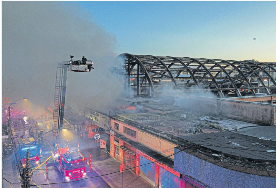
Más de 20 unidades de Bomberos se desplegaron en el centro de Concepción para combatir el fuego y evitar su propagación.

Los trabajos realizados por más de 20 unidades de Bomberos estuvo enfocado desde temprano en apagar algunos focos secundarios de incendios desplegando voluntarios para atacar el fuego desde el techo del mercado y utili-