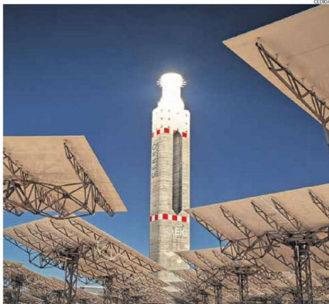
LA TORRE PRINCIPAL, DE CERRO DOMINADOR, DE 150 METROS, ES UNA DE LAS ESTRUCTURAS MAS ALTAS DEL PAÍS.

Cuenta con una capacidad de 110 MW en su planta termosolar, gracias a sus 10.600 espejos (heliostatos) repartidos en una superficie de 700 hectáreas, que reflejan la luz del sol, concen-