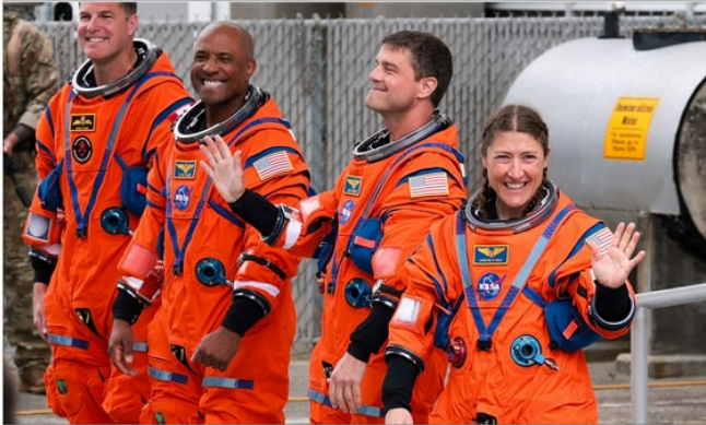
La tripulación: Reid Wiseman, Víctor Glover, el canadiense Jeremy Hansen y Christina Koch.

Desde su posición no veía el reloj con la cuenta regresiva, así que desde Chile, amigos y familiares le iban avisando cuánto faltaba.