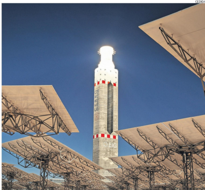
LA TORRE PRINCIPAL, DE CERRO DOMINADOR, DE 150 METROS, ES UNA DE LAS ESTRUCTURAS MÁS ALTAS DEL PAÍS.

Cuenta con una capacidad de 110 MW en su planta termosolar, gracias a sus 10.600 espejos (heliostatos) repartidos en una superficie de 700 hectáreas, que reflejan la luz del sol, concen-