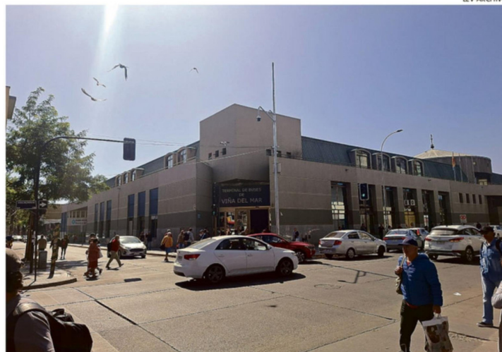
EL PUNTO DE IDA Y LLEGADA DE LA CIUDAD JARDÍN PERMANECE BAJO LUPA POR LA INSEGURIDAD.

2 veces ha fracasado el concurso público para la contratación de guardias tácticos en el terminal de Viña del Mar.