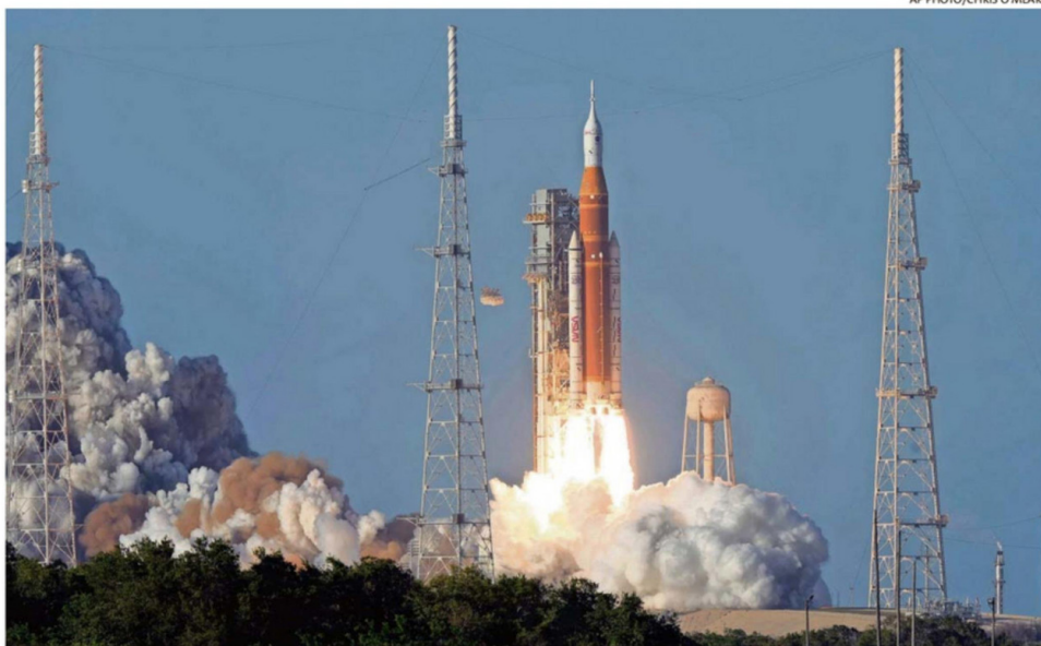
EL DESPEGUE OCURRIÓ SEGÚN LO PREVISTO, PASADAS LAS 19.30 HORAS EN CHILE.

NASA mantuvo una transmisión ininterrumpida del último amanecer sobre la Tierra de los tripulantes.