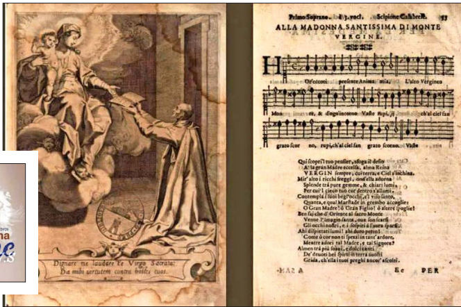
Portada del librito y disco. A través de un código QR se pueden revisar los facsímiles.

Se trata de "Tempio Armonico della beatissima Vergine N.S.", canciones dedicadas a María y que fueron registradas por músicos chilenos.