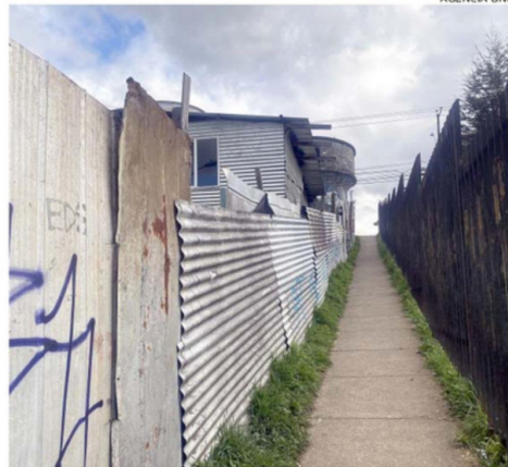
HUBO 7 DETENIDOS ESTA SEMANA EN EL “FOLILCHE” POR NARCOTRÁFICO.

mente, quienes sufren las consecuencias son los vecinos aledaños y la ciudad en su conjunto. Osorno concentra más campamentos en el sur porque aquí no se fiscaliza como corresponde”.