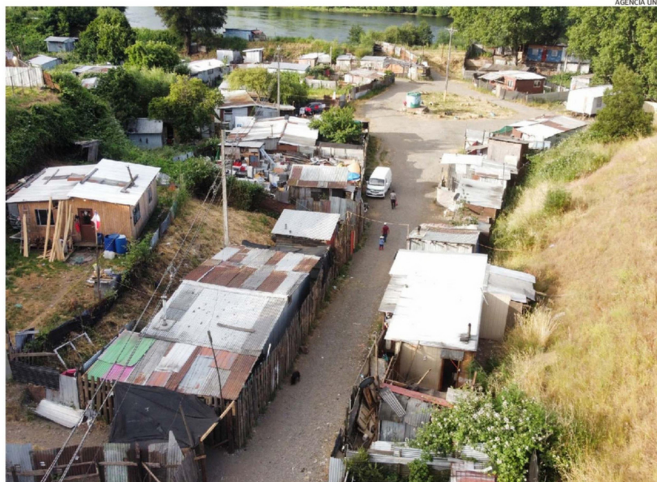
LA TOMA ILEGAL "CHAURAKAWÍN" ES UNA DE LAS MÁS PROBLEMÁTICAS. HA SIDO BLANCO DE DIVERSOS OPERATIVOS ANTI DROGAS Y DE DELINCUENTES.

OSORNO. La detención de una banda criminal de extranjeros en la toma "Folilche" reabre el problema que representan los asentamientos que surgieron en octubre de 2019 para los barrios adyacentes. Son focos de droga, delincuencia e insalubridad. A diferencia de ciudades como Valdivia, donde la alcaldesa lideró un desalojo, en Osorno no se ha concretado ninguno. Es más, los dirigentes sienten que todos -incluidos alcaldes y delegados- se han tirado el problema unos a otros.