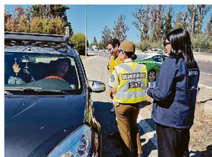
SE INTENSIFICARÁN LOS CONTROLES EN LAS CARRETERAS.

"La oferta es variada, todas las comunas y destinos tienen preparadas actividades, como la Feria Sobre mesa en tantes, o el consumo que tengan en esos días, pero apostamos a que esto no nos afecte más de un 4 a 6% en los próximos fines de semana".