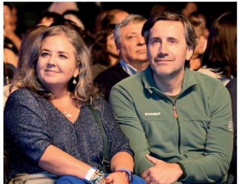
© Paola Muñoz y Alberto Kresse, presidente del directorio de Acades.