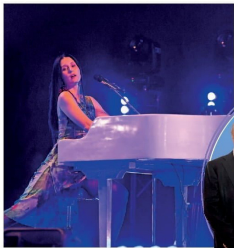
© Cerca de dos mil personas disfrutaron de una jornada cultural con el cierre musical de Francisca Valenzuela.