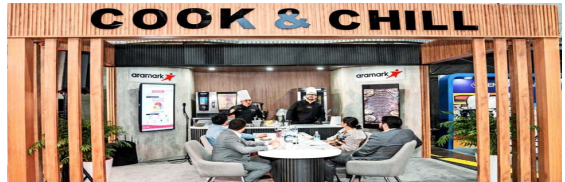
Los visitantes pudieron degustar múltiples preparaciones, incluidas las recetas de la nueva planta productiva de Aramark que elabora platos con la última tecnología de cook and chill.

Con este evento, Aramark no solo busca dar a conocer las últimas tendencias y novedades en la industria de servicios, sino también generar un espacio de conversaciones y colaboración que permita acelerar la innovación en su rubro.