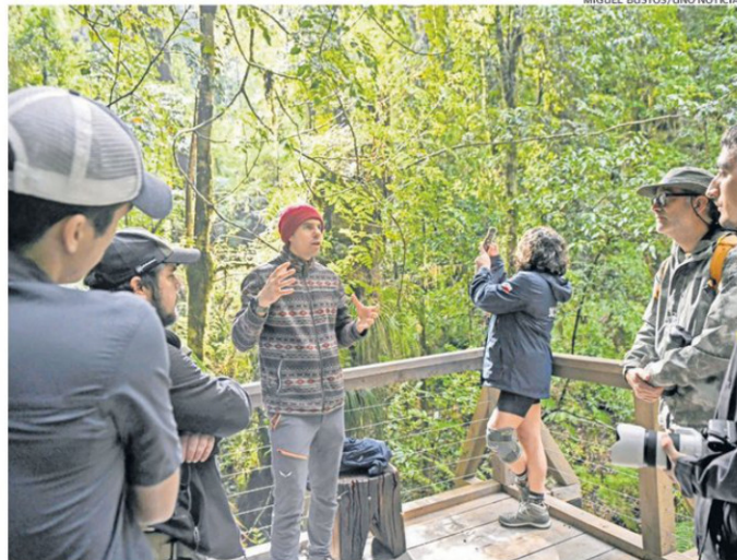
PIRINEL ES UN PROYECTO SIN FINES DE LUCRO. EL PARQUE ESTÁ ABIERTO AL PÚBLICO DESDE EL 14 DE FEBRERO DE ESTE AÑO, PERO EN MODALIDAD DE MARCHA BLANCA.