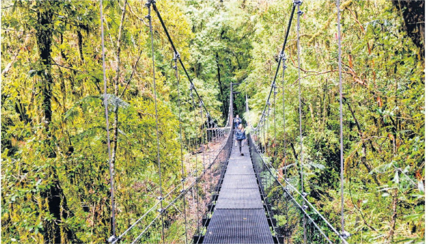
EL PARQUE PIRINEL, INICIATIVA DE FUNDACIÓN LUKSIC, SE UBICA CERCA DE CHOSHUENCO. CONSIDERA 12 MIL HECTÁREAS Y MÁS DE 10 KILÓMETROS DE SENDEROS.