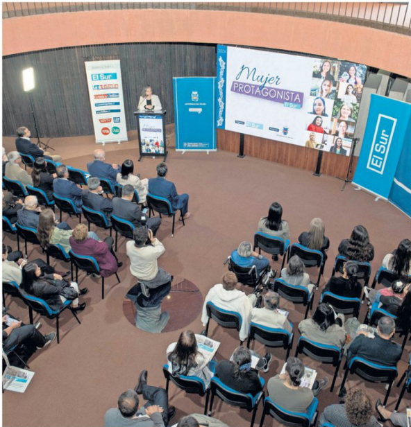
La actividad de reconocimiento a las distintas mujeres destacadas por su labor se realizó en el Edificio de Innovación de la UBB.