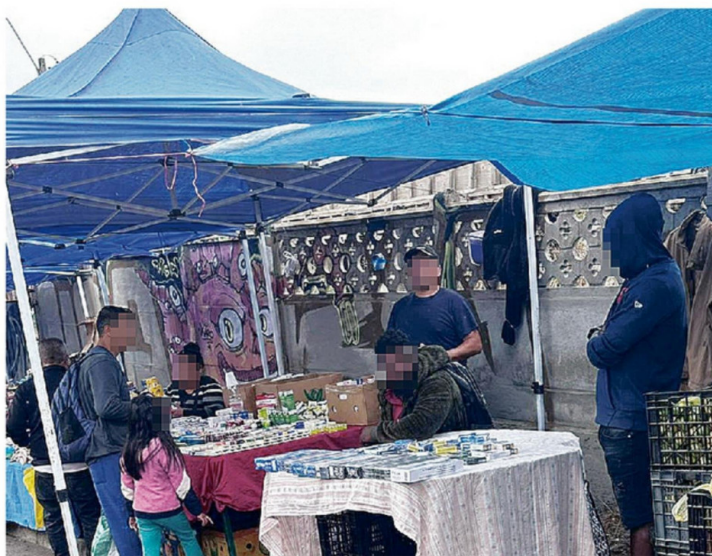
EN LAS FERIAS LIBRES ES FÁCIL ENCONTRAR CIGARRILLOS DE CONTRABANDO.

Es difícil creer que quienes desarrollan esta red global de internación de cargas ilegales solo lo hagan para internar cigarrillos ilegales y no otro tipo de sustancias más nocivas que son producidas en el continente asiático, tales como metanfetaminas, fentanilo, éxtasis (Mdma), entre otras. El contrabando de cigarrillos bien puede estar relacionado con la