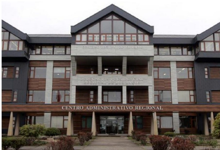
EN LAS OFICINAS DE LA DELEGACIÓN PRESIDENCIAL REGIONAL SE CONCENTRA EL GABINETE DEL GOBIERNO EN LA REGIÓN DE LOS LAGOS.

CENTRALISMO. Corresponde a las carteras de Energía, Economía y Gobierno, mientras que la provincia de Llanquihue -asociada a la capital regional Puerto Montt- concentra 10 profesionales nombrados. Dirigentes de partidos y autoridades de la provincia acusan centralismo político en las designaciones, lo que evidencia un retroceso para la igualdad territorial considerando que la provincia de Chiloé cuenta con sólo dos y Palena ninguno.