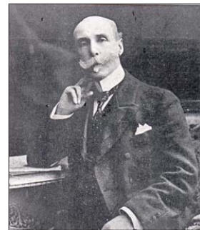
Alberto Blest Gana fue embajador entre 1869 y 1887 en París.

En sus reportes, Lynch deja claro que el peligro era real y que era mejor pagarle al jefe de la Armada turca. También señala que negoció con él la entrega parcelada de las seis mil libras esterlinas y acordó, además, que sus esfuerzos por impedir la venta del acorazado se extenderían por dos meses más, a costa del primer pa-