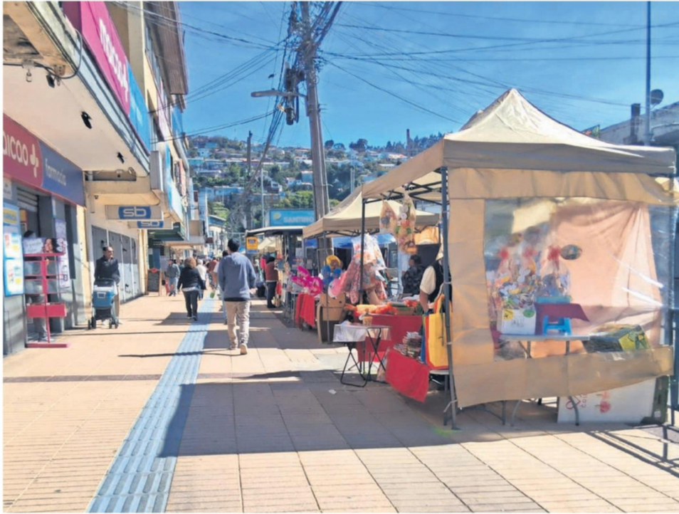
ESTE TIPO DE TOLDOS Y DISPUESTOS EN ESPACIOS DELIMITADOS, ES LO QUE SE PERMITE DESDE AHORA EN AV. COLÓN EN TALCAHUANO. MUNICIPALIDAD DE TALCAHUANO