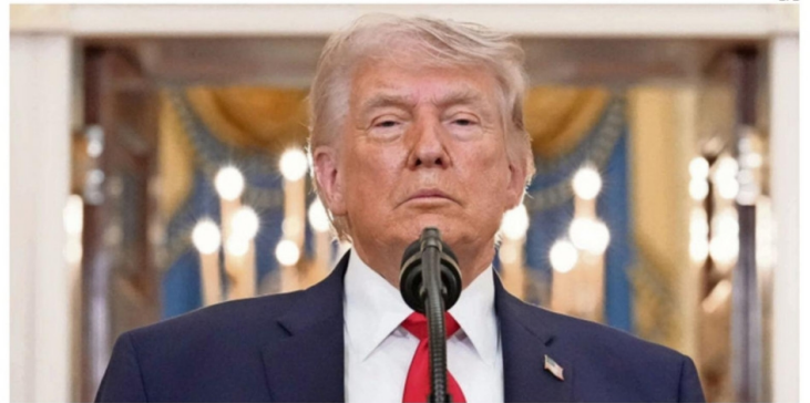
"ABRAN EL PUTO ESTRECHO", AMENAZÓ DONALD TRUMP.

Por otro lado, Trump reveló ayer que el segundo militar rescatado tras un intenso operativo después de que el caza que pilotaba fuera abatido por Irán el viernes está "gravemente herido". El soldado estuvo siete horas en territorio enemigo hasta que fue recuperado tras dos incursiones.