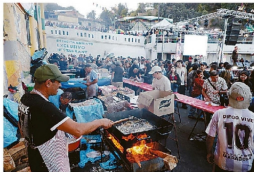
FUE UNO DE LOS HITOS MÁS ATRACTIVOS DEL FIN DE SEMANA,