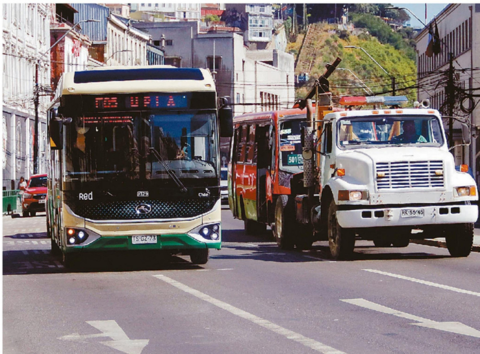
LA IDEA DE LA ANSIADA LICITACIÓN ES LLEGAR A 2.000 NUEVOS BUSES AL TÉRMINO DE LAS TRES ETAPAS.

Su explicación apunta a que esta modificación de comportamientos se da en la población “siempre y cuando tengan un buen sistema de transporte público y los tiempos de viaje les acomoden como para cambiarse de modo de transporte”. Dicho de otra forma, la alternativa debe