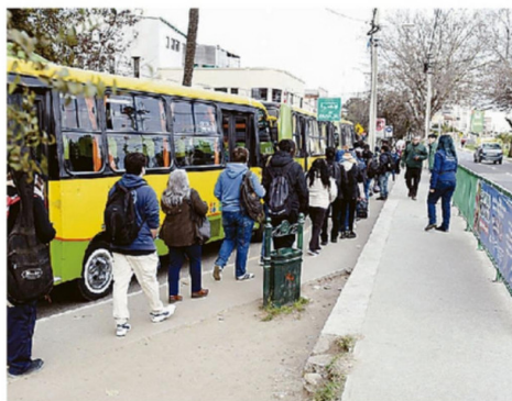
ACTUALMENTE SOLO DOS UNIDADES DE NEGOCIO SE HAN LICITADO.

Como representante de una agrupación nacida con el objetivo de abordar las debilidades del sistema de transporte, expresa que ante esta situación, cobra relevancia la necesidad de propiciar mejoras. “Bien sabemos que el aumento