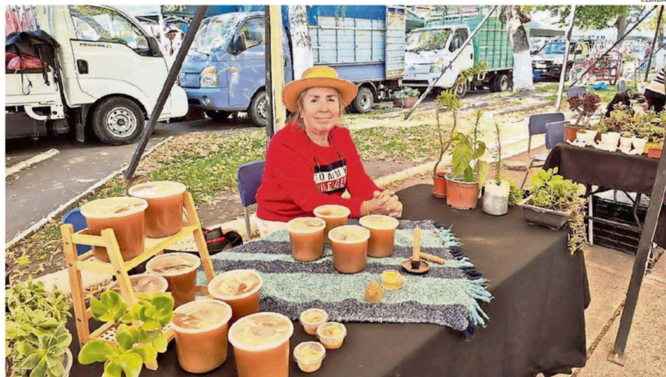
ERIA APÍCOLA Y FLORÍCOLA EN QUILLÓN REUNIÓ A PRODUCTORES LOCALES, DESTACANDO LA DIVERSIDAD DE PRODUCTOS.