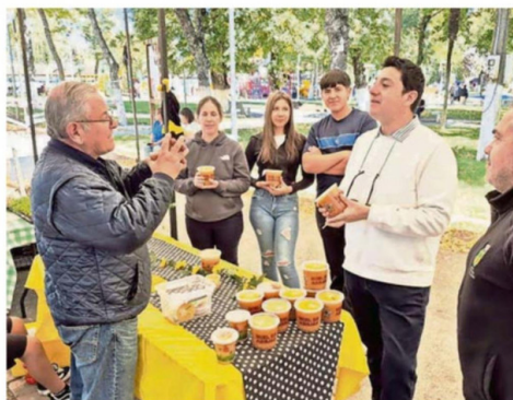
EXPOSITORES LOCALES EXHIBIERON MIEL, PLANTAS Y PRODUCTOS DERIVADOS EN UNA JORNADA QUE BUSCÓ POTENCIAR EL COMERCIO RURAL.