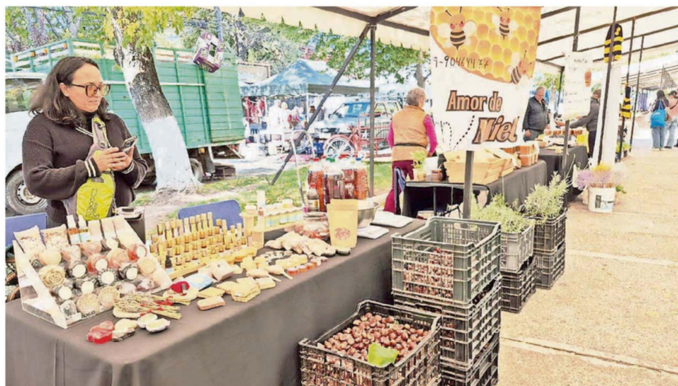
WL MUNICIPIO DE QUILLÓN REFUERZA APOYO AL DESARROLLO LOCAL CON EVENTO QUE INTEGRÓ APICULTURA, FLORICULTURA Y ARTESANÍA, FORTALECIENDO LA ECONOMÍA Y LA IDENTIDAD TERRITORIAL.