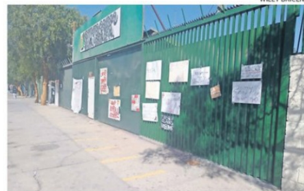
EL RETORNO A CLASES DE LOS ESTUDIANTES DE MANERA GRADUAL.

Aunque el Colegio IOSL contaría con uno de los argumentos, que es aquel que se habrían originados casos de violencia escolar. Pero, estarían pendientes otros aspectos, tanto en la forma de implementación como operatividad, considerando que toda la comunidad deberá de pronun-