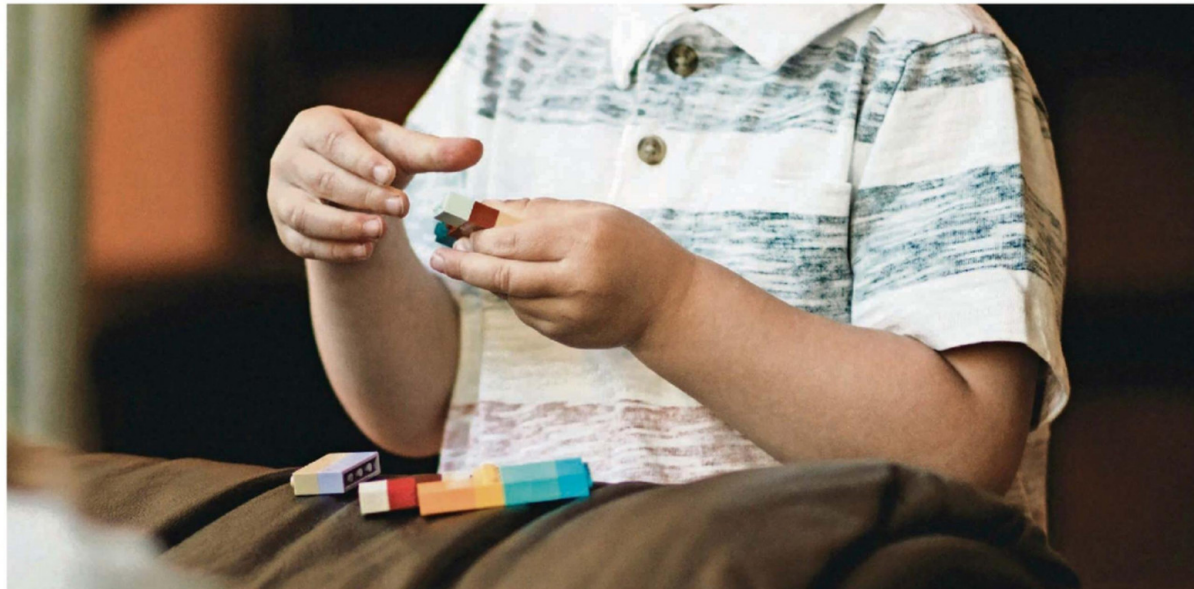
LOS RESULTADOS DE ESTE ESTUDIO FUERON PRESENTADOS AL MINISTERIO DE DESARROLLO SOCIAL Y FAMILIA.

un acceso equitativo a intervenciones oportunas y de calidad, especialmente para las familias en contextos de mayor vulnerabilidad".