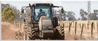
Agricultores alertan crisis por alza en los costos de producción