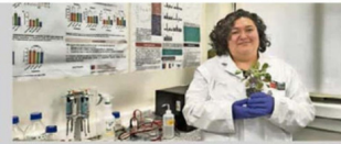
Postcosecha: cómo mantener la calidad de la frutilla