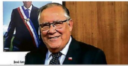
Los cinco ejes del ministro Jaime Campos