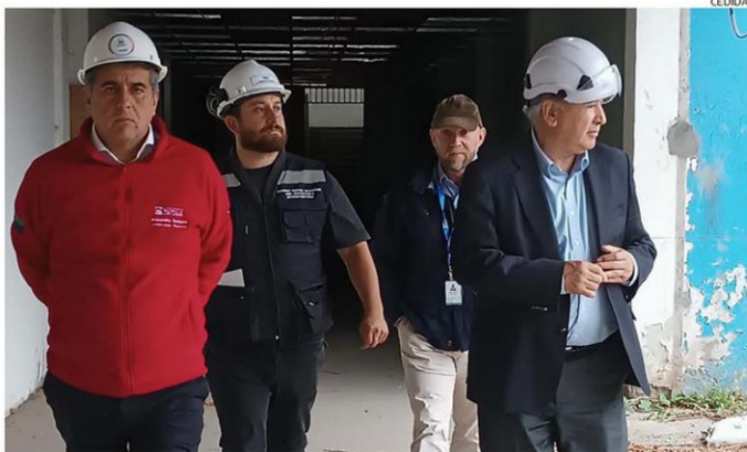
EL GOBERNADOR ALEJANDRO SANTANA (DE ROJO) JUNTO AL ALCALDE BERTÍN (CON CAMISA CELESTE) EN EL LICEO.

Además, a inicios de marzo, la misma empresa ingresó una denuncia formal ante el