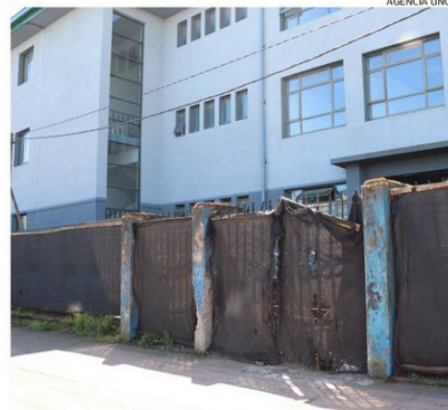
EL LICEO ESTÁ ABANDONADO, SEMI DESTRUIDO Y DESMANTELADO.

era el costo de inversión para la reposición del recinto, provenientes del Fndr. Inicialmente se aprobaron $7.239 millones y luego, en el 2022, se sumaron $1.402 millones.