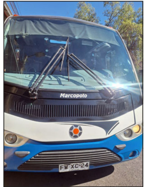
El conductor durante uno de sus recorridos, labor por la cual ha sido reconocido por su empatía y vocación de servicio.

«Cuando una persona se sube a una máquina, por lo menos para mí, es responsabilidad de uno (...) cada persona que sube, uno es responsable», afirmó, reflejando una visión profundamente humana de su labor.