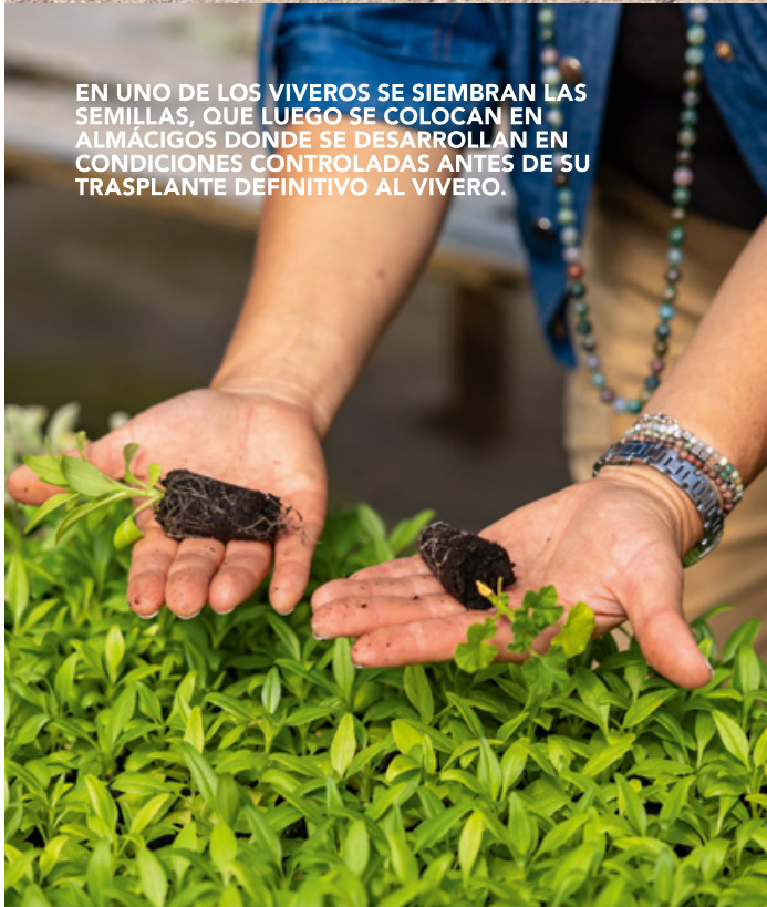
EN UNO DE LOS VIVEROS SE SIEMBRAN LAS SEMILLAS, QUE LUEGO SE COLOCAN EN ALMÁCIGOS DONDE SE DESARROLLAN EN CONDICIONES CONTROLADAS ANTES DE SU TRASPLANTE DEFINITIVO AL VIVERO.