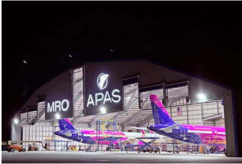
APAS Chile opera en Santiago, siendo la única empresa en Sudamérica de SIP Holding.

— DAS (Diverse Aircraft Services), empresa especialista en reparación de estructuras de