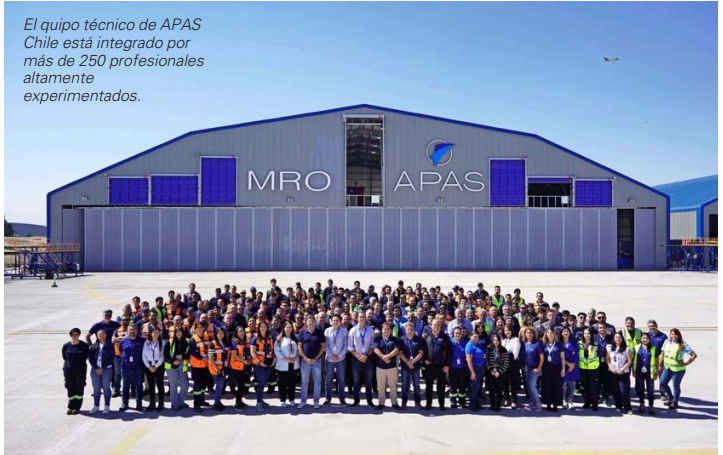
El equipo técnico de APAS Chile está integrado por más de 250 profesionales altamente experimentados.

"Como parte de nuestro plan de expansión, APAS Chile está desarrollando 100.000 m 2 adicionales de losa para sus operaciones y construyendo dos