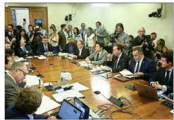
El director general de la PDI, Eduardo Cerna, expuso por casi una hora ante la comisión de Seguridad Ciudadana.

> Opción que toma fuerza es que en la Operación Renta del próximo año el recorte en la tasa a las empresas sea solo de medio punto —en vez de uno— y que en 2028 la rebaja pueda ser de una magnitud mayor. | B 1