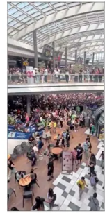
Influencers hicieron convocatoria en centro comercial ubicado en la comuna de La Florida.

> La defensa del exfrentista afirma que no habría debido proceso en nuestro país y recurre a Naciones Unidas para evitar su arresto con fines de extradición. | C 2