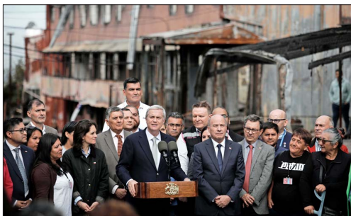
A mediados de marzo, el Presidente José Antonio Kast anunció los ejes del Plan de Reconstrucción Nacional, que incluirá las rebajas de impuestos.

Surge la opción de que en la Operación Renta del año 2027 el recorte en la tasa a las empresas sea de solo medio punto y en 2028 la rebaja pueda ser de una magnitud mayor.