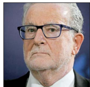
Roberto Zahler, ex presidente del Banco Central.

En el encuentro se analizaron las implicancias fiscales de recorte del impuesto corporativo que propundrá el Ejecutivo y cómo golpeó las proyecciones macroeconómicas la fuerte alza en los combustibles que anunció hace dos semanas el ministro de Hacienda, Jorge Quiroz.