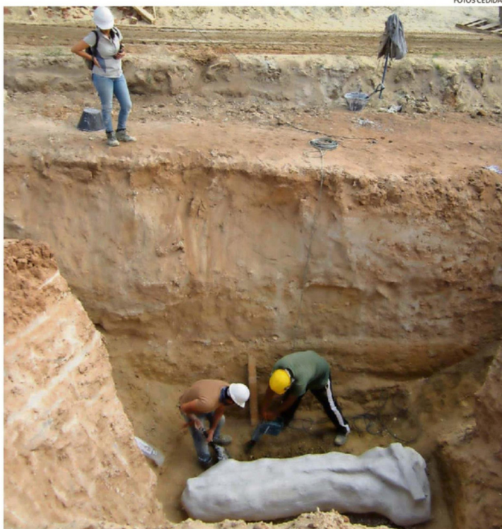
LA INVESTIGACIÓN USÓ ANTECEDENTES DE MONITOREOS A OBRAS EN COQUIMBO.

El profesional es el director científico de la Corporación de Investigación y Avance de la Paleontología e Historia Natural de Ataca-