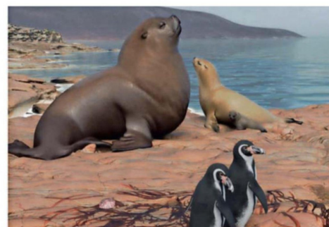
HABÍA MÁS FOCAS QUE LOBOS MARINOS Y GRANDES PINGÜINOS.

Así, el estudio confirmó que hasta hace 3 millones de años la temperatura del mar superficial del norte chileno era de unos 17.1 °C promedio, lo que es entre 3 y 4 grados más cálida que lo estimado durante el Pleistoceno, hace unos 800.000 años. Esto se asemeja más a las aguas actuales de Perú.