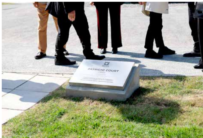
Frente a la estructura, se ubicó la placa que lleva el nombre del autor para recordar en la posteridad dicho momento de inauguración.