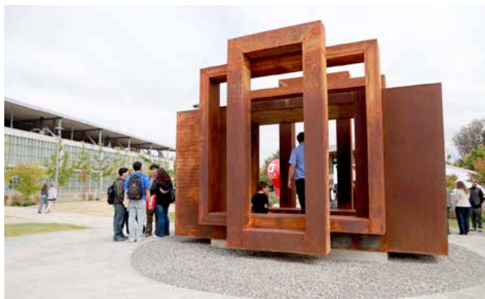
La estructura fusiona la arquitectura y la escultura para brindar un espacio único.