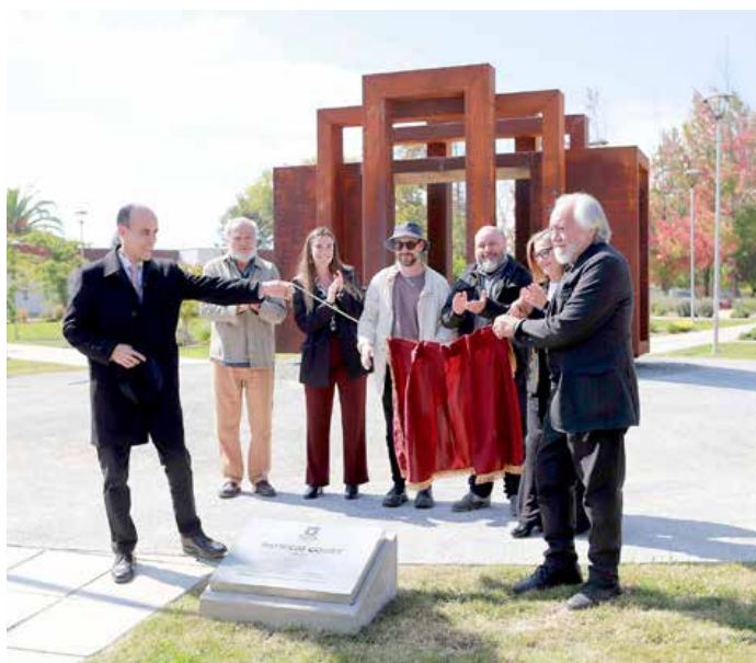
El momento de descubrir la placa fue compartido por el rector de la casa de estudios y el autor de la escultura entre los aplausos de la comunidad.