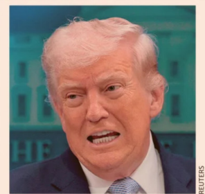
ABBAS ARAGHCHI MINISTRO DE ASUNTOS EXTERIORES DE IRÁN

“Hemos cumplido y superado todos los objetivos militares y estamos muy avanzados en la negociación de un acuerdo definitivo”.