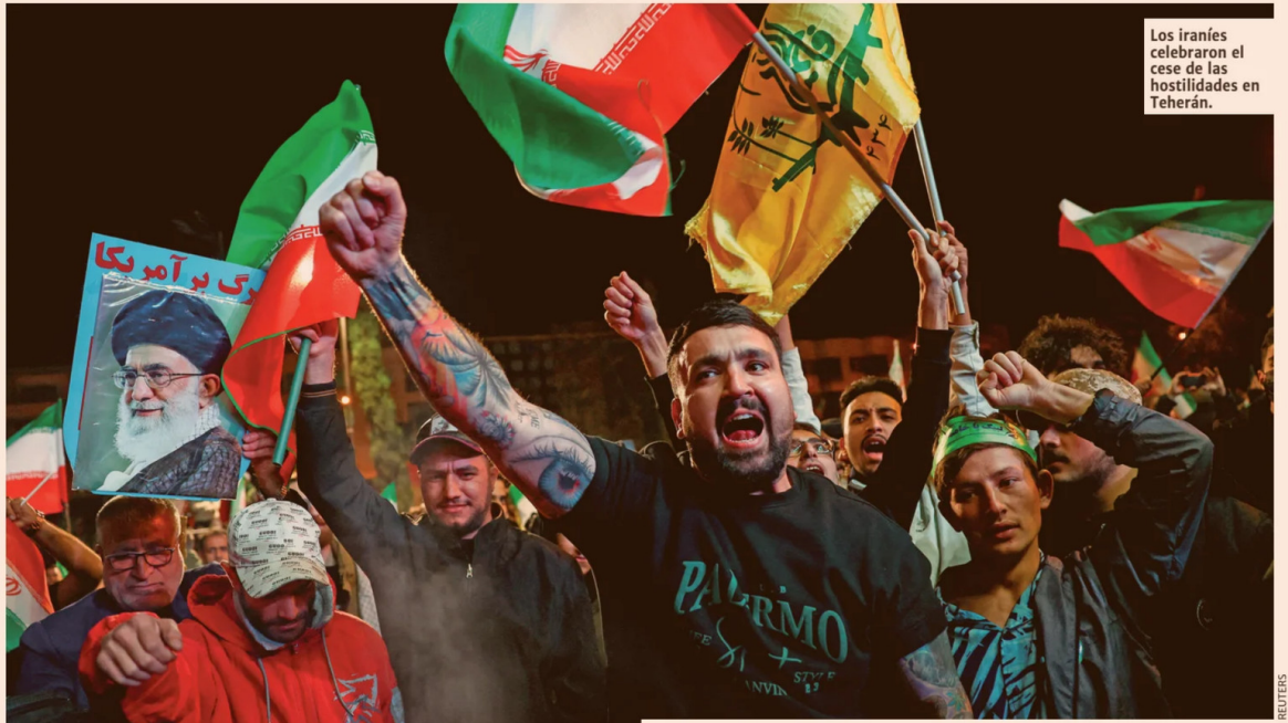
Los iraníes celebraron el cese de las hostilidades en Teherán.

Cabe destacar que, de acuerdo a un funcionario de la Casa Blanca citado por Financial Times, Israel aceptó el alto al fuego. De hecho, Sharif detalló en X que el cese de las agresiones incluye al Líbano