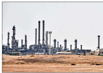
Hasta ayer por la tarde, el precio de los principales referentes del petróleo (WTI y Brent) había caído a sus menores niveles en casi un mes.

El anuncio llega tras casi mes y medio de un conflicto que redefinió las expectativas sobre cualquier señal de inflación y riesgo geopolítico en to-