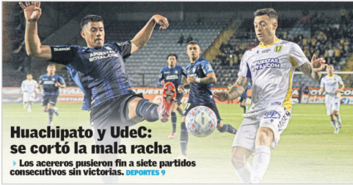
Huachipato y UdeC: se cortó la mala racha Los acereros pusieron fin a siete partidos consecutivos sin victorias. DEPORTES 9