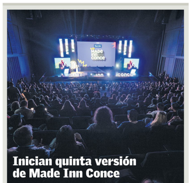
Inician quinta versión de Made Inn Conce El evento, que se extiende hasta mañana en el Teatro Biobío, aborda el desarrollo de startups y exportación de servicios, además de contar con 125 expositores. ECONOMÍA 7