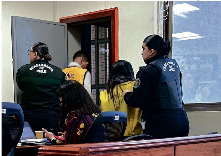
LOS IMPUTADOS DE 25 Y 26 AÑOS ENFRENTAN UN JUICIO ORAL. LA FISCALÍA SOLICITA QUE SEAN CONDENADOS A CADENA PERPETUA.

"Posteriormente, a eso de las 4.40 horas, los imputados junto a la menor de edad, se dan a la fuga del domicilio con especies sustraídas (consistentes en dinero y artículos de valor), dirigiéndose al terminal de buses de la comuna de San Antonio y en un viaje sin detenerse abordan un bus en (el terminal) San Borja de la Región Metropolitana, rumbo al terminal de Arica,