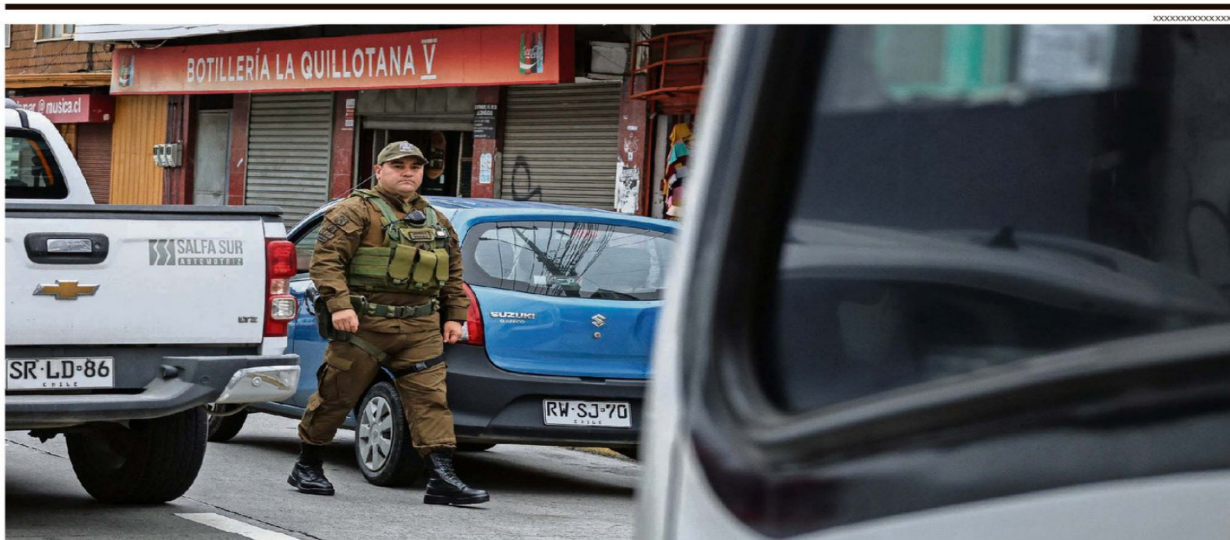
CÁMARA DE COMERCIO DE PUERTO MONTT VINCULA MENOR VICTIMIZACIÓN CON ERRADICACIÓN DE AMBULANTES. PARA ELLO HA SIDO CLAVE LA IMPLEMENTACIÓN DE LA ORDENANZA MUNICIPAL Y LA FISCALIZACIÓN CALLEJERA.