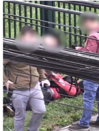
LOS ADOLESCENTES QUE INGRESARON AL LPN CON ARMAS FUERON DETENIDOS MIENTRAS ESCAPABAN.

apuntó el delegado deslizando una relación que podría tener nexos políticos.