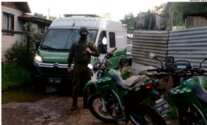
ENTRE LAS INTERVENCIONES SE INCLUYE UN MAYOR RESGUARDO POLICIAL EN LAS ÁREAS MÁS COMPLEJAS.

Añadió que "en estos lugares ya han ocurrido hechos de