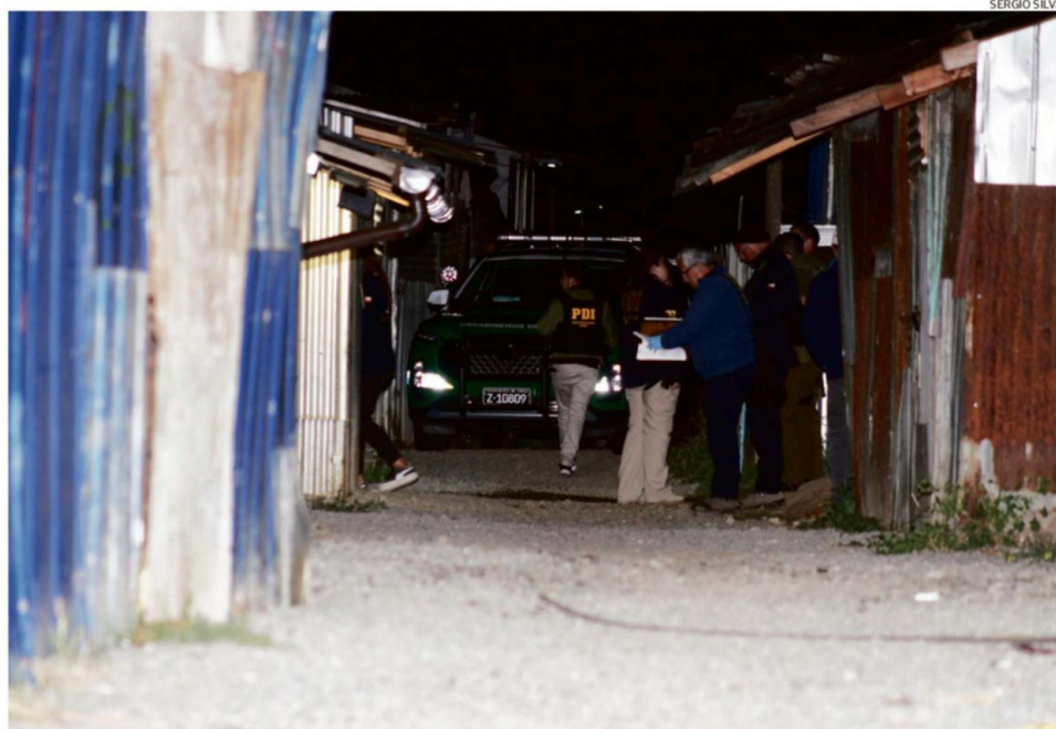
EL PLAN DE INTERVENCIÓN EN BARRIOS CRÍTICOS CONSIDERA ACCIONES MÁS RADICALES LIDERADAS POR LAS POLICÍAS, FISCALÍA, ENTRE OTROS ENTES.

OSORNO. Se trata de una iniciativa impulsada por el Ministerio de Vivienda que considera a Rahue Alto, donde se han identificado tomas y viviendas que son usadas por narcotraficantes. Se agrega la recuperación de áreas verdes y construcción de viviendas sociales. Las acciones más complejas serán durante el primer semestre. Alcalde aún no es informado, pero está dispuesto a ayudar.