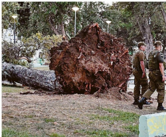
FUE EL 17 DE FEBRERO CUANDO OCURRIÓ LA TRAGEDIA.

tregue un informe sobre el mencionado bien nacional de uso público y su mantención, entre otras cosas.