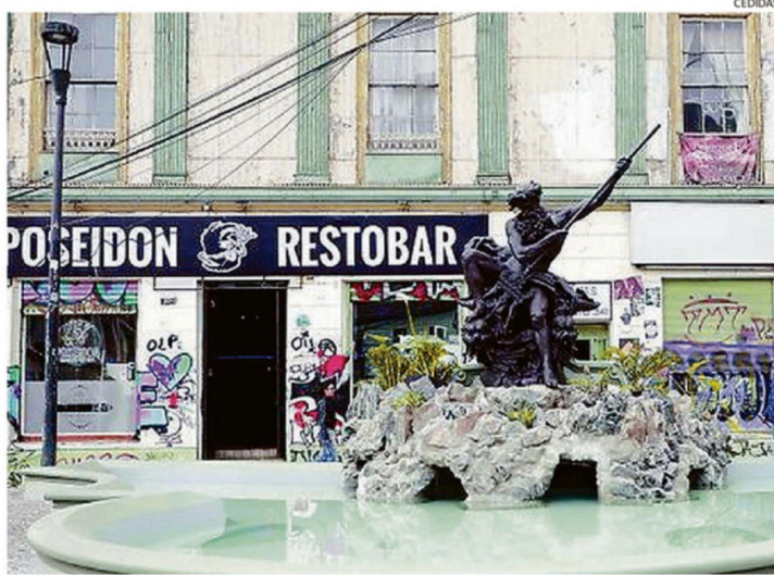
TRES MESES DE TRABAJO LLEVÓ LA RESTAURACIÓN DE LA FUENTE NEPTUNO EN LA PLAZA ANÍBAL PINTO.

En esa línea, el Municipio rectificó la información e hizo énfasis en que el actuar de Seguridad Ciudadana y los uniformados