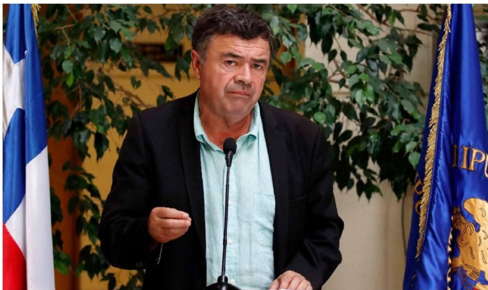
► Esteban Valenzuela, exministro de Agricultura durante el gobierno del expresidente Boric.

“Es importante hacer un llamado a la cautela y a la responsabilidad porque no puede ser este ataque el caballito de Troya para quienes siempre han estado en contra de la gratuidad universitaria”, solicitó la jefa de