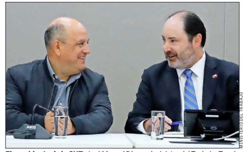
El presidente de la CUT, José Manuel Díaz, y el ministro del Trabajo, Tomás Rau, sostuvieron un primer encuentro protocolar el 24 de marzo.

multisindical, José Manuel Díaz, indicó que “queremos llegar a la mesa (con el Gobierno) con datos actualizados y una propuesta que realmente responda a la realidad que están viviendo los trabajadores”. Demandó que esperen que