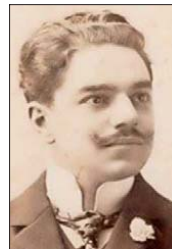
El arquitecto Ricardo Larraín Bravo dejó en Santiago una dúctil obra arquitectónica.

Una vez elaborado el diagnóstico final, la idea es generar una coordinación con la institucionalidad patrimonial, en particular el Consejo de Monumentos Nacionales, para trabajar una estrategia adecuada de restauración del templo. Los prolijos planos de Larraín Bravo, guardados durante casi un siglo en un rincón del templo de los Sacramentinos, serán ahora clave para comprender la evolución constructiva del edificio y emprender el ansiado camino para su completa restauración, que ha tardado tantos años.