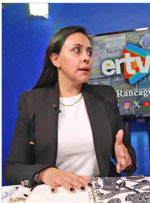
La seremi sugirió una serie de iniciativas para motivar la descentralización y difusión de las actividades deportivas de O'Higgins.