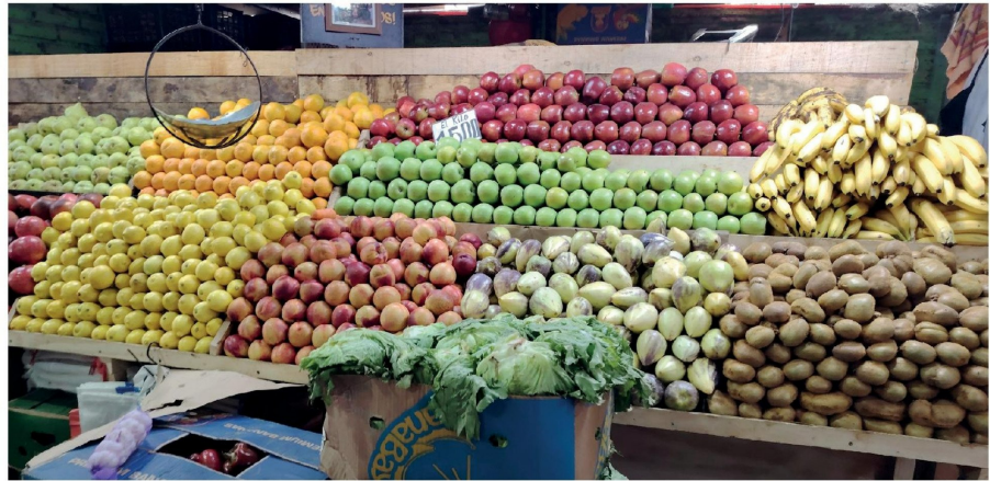
PRODUCTOS LOCALES MUESTRAN mayor estabilidad frente al alza de costos en la Vega de Los Ángeles.

Un alza de hasta un 15% en frutas y verduras podría registrarse en los próximos días en la Vega de Los Ángeles, impulsada por el aumento en los costos de combustibles y fertilizantes, factores que inciden directamente en la producción y distribución de estos productos.