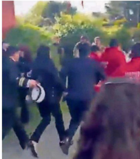
La ministra tuvo que escapar entre una turba que la esperó por horas afuera de la Aula Magna para agredirla.