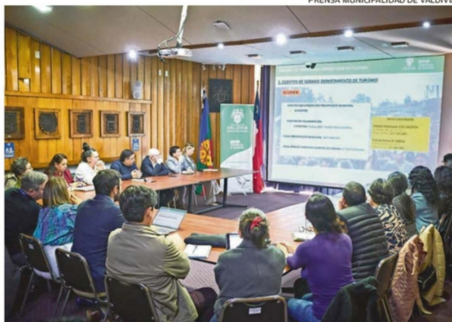
PRENSA MUNICIPALIDAD DE VALDIVIA.

“Por ello, tenemos que llegar a nuevos turistas y, por lo tanto, ofertar mejores destinos. En ese sentido, vamos a seguir trabajando en una articulación público-privada con todas las