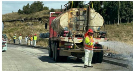
AÚN RESTAN ALGUNOS TRABAJOS EN EL BYPASS DE CASTRO.

ría destacó que “esta gira que hemos estado haciendo es para poder conversar con cada uno de los alcaldes, conocer sus urgencias e iniciativas que hay en cada municipio y aquellas cosas que son importantes en cada una de estas comunas”.