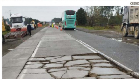
EL TRAMO ANCU D-DEGAÑ DE LA RUTA 5 TIENE COMPLICACIONES.