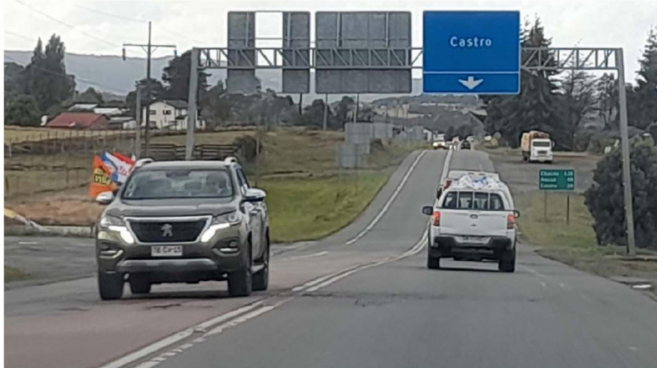
EL TRAMO DE LA PANAMERICANA ENTRE CHONCHI Y QUELLÓN ACTUALMENTE SE ENCUENTRA EN LA FASE DE ESTUDIO INTEGRAL.

Carolina Larenas Faúndez carolina.larenas@laestrellachiloec.cl